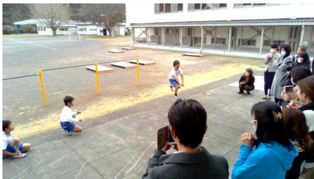
3年生 <今と昔のあそびくらべ発表会>