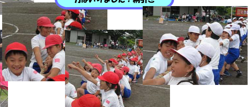
力はいりました！綱引き