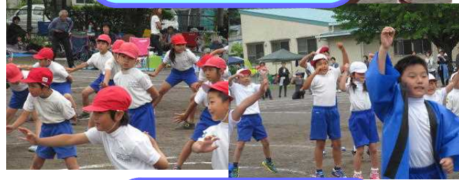
迫力のソーラン踊り